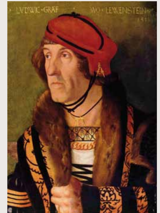
Ludwig I. von Löwenstein, 1513, Gemälde von Hans Baldung